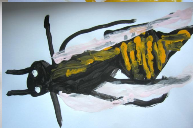
Malerier av veps og foto av vepsebol som vi studerte.